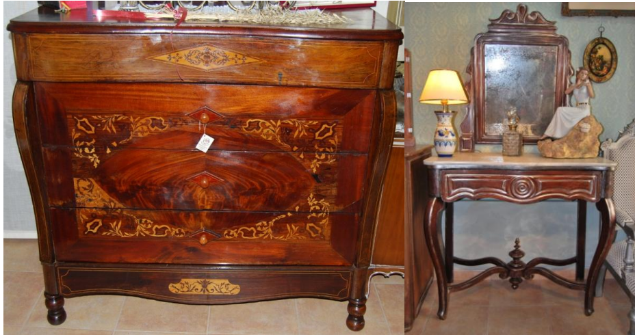
Cómoda Isabelina de marquetería